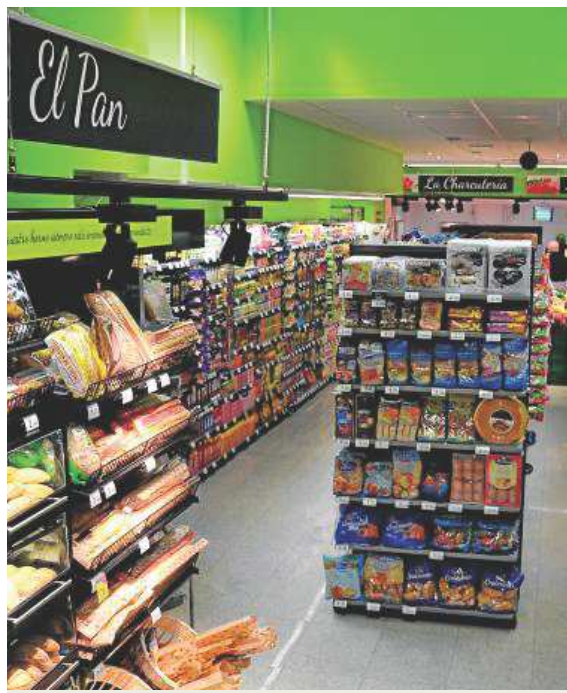
Carrefour Express. LP

CRECIMIENTO Sus supermercados Express cuentan con las ventajas de un establecimiento de barrio