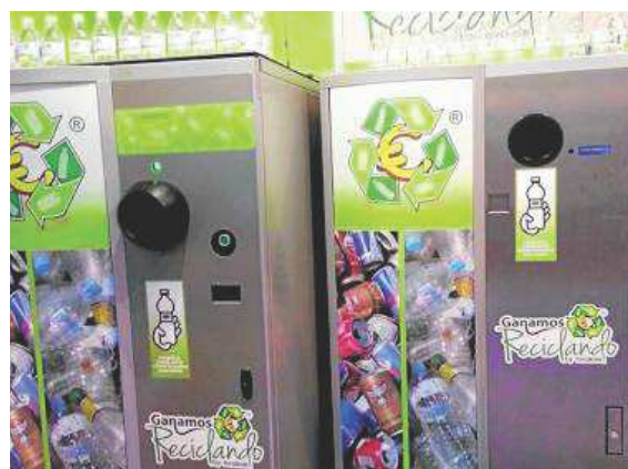
Máquinas de reciclaje.

Las máquinas de reciclaje ofrecen al usuario la posibilidad de reciclar a cambio de monedas o vales descuento en comercios adheridos, quien recicla se ve incentivado y lo nota en su bolsillo y economía doméstica. Estas máquinas funcionan desde hace más de una década en varios países del norte de Europa con excelentes resultados medioambientales, al tiempo que colaboran con el no abandono de envases.