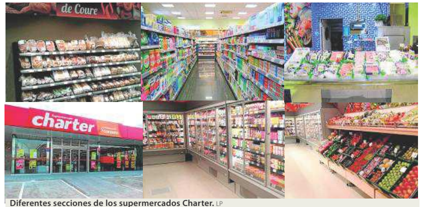
Diferentes secciones de los supermercados Charter. LP

Contar con la sexta empresa de distribución de España es una garantía porque dispone de logística centralizada y gratuita con todos los servicios (frescos, refrigerados, congelados...); cesión de equipos informáticos y sistemas de gestión diseñados por Consum para una mayor eficacia de todos los procesos, facilidades de financiación para el pedido inicial de llenado, plan promocional con ofertas mensuales con publicidad y cartelería sin coste y adhesión gratuita al programa de fidelidad 'Mundo Consum'.