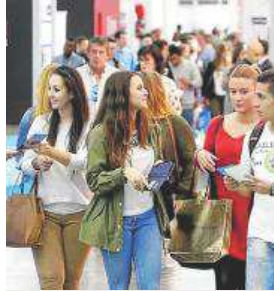
Muchos jóvenes visitan SIF.

Los datos que revela este estudio señalan que 11 de cada 100 emprendedores españoles interesados por la franquicia se ubican en la Comunitat Valenciana; que más del 60 por ciento tienen entre 30 y 60 años; y que el 22 por ciento ya ha encontrado o dispone de un local en el que abrir el negocio franquiciado. Respecto a los sectores más demandados, son la hostelería/restauración y confección/moda, con más de cuatro de cada diez solicitudes.