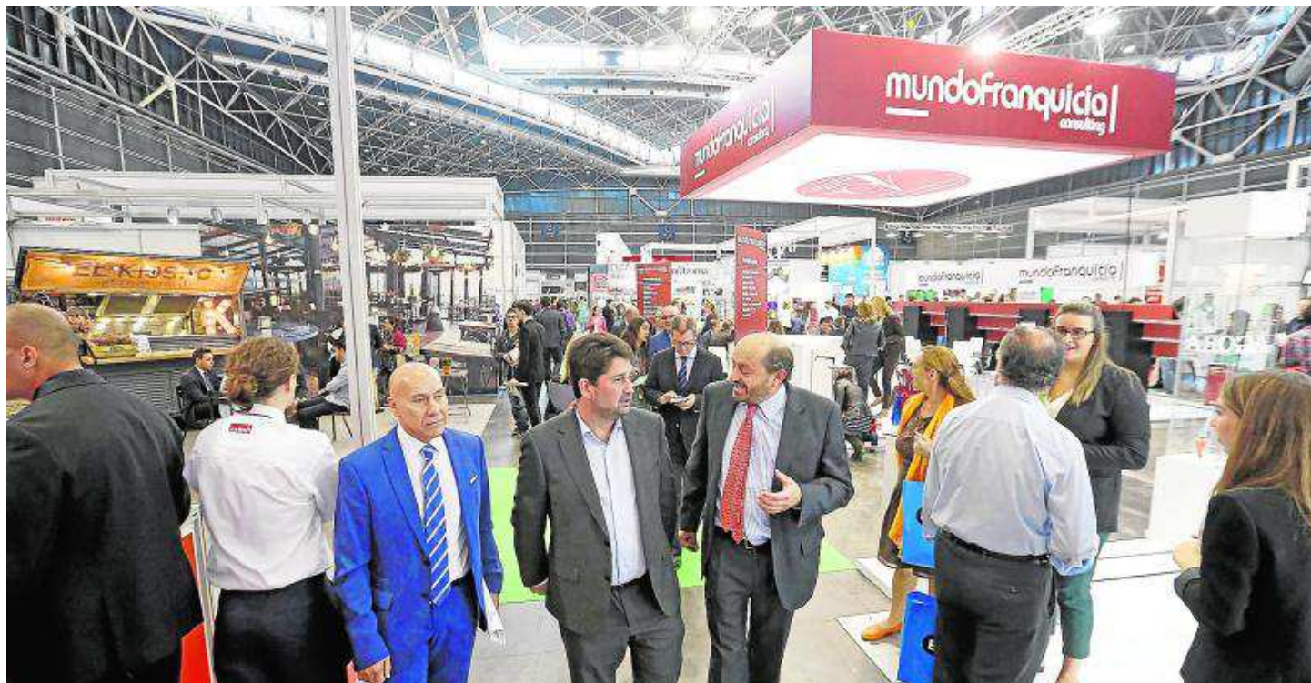
El Nivel 3 del Pabellón 2 volverá a acoger esta gran cita. LP

De forma paralela a su escaparaté comercial, SIF ha preparado un amplio programa de conferencias y charlas que tendrán lugar en el Aula de la Franquicia y que ha contado con la colaboración de las consultoras en franquicia Barbadillo Asociados y MundoFranquicia. Por otro lado, otorgará el Premio Nacional de Franquicia, que esta convocatoria llega a su vigésimo primera edición, que premia a las enseñanzas más destacadas en cada una de las diferentes candidaturas.